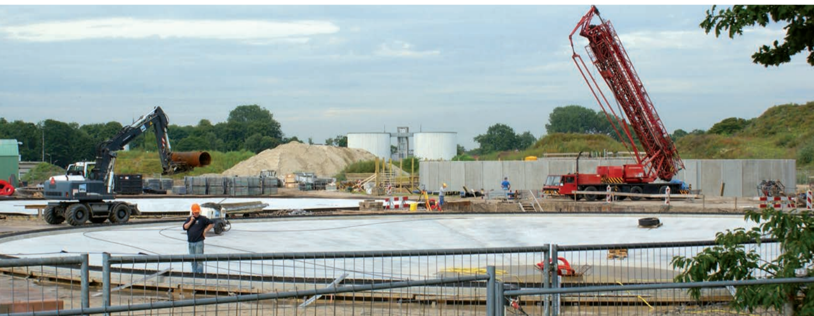
De nieuwe rioolwaterzuivering in aanbouw. Op de achtergrond de oude waterzuiveringsinstallatie.

Zaterdag 29 september gaan we ook in het gebied zelf kijken. En voor de kinderen is er ook wat leuks te doen. Binnenkort staat het programma op www.woneninannashoeve.nl .